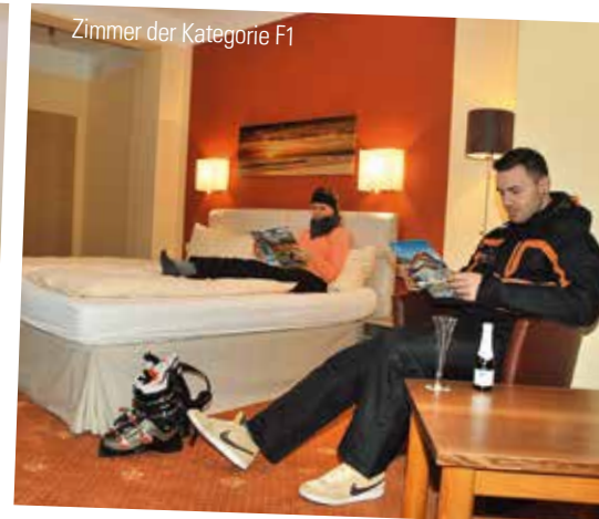
Zimmer der Kategorie F1