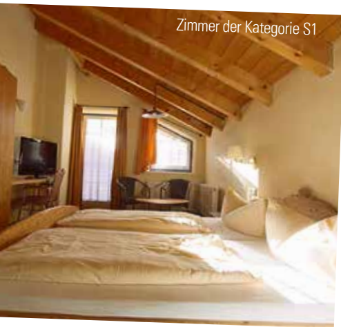
Zimmer der Kategorie S1

Ihr SCOL-Plus: Tischgetränke wie Bier, Wein und ausgewählte Softdrinks sind zum Abendessen enthalten!