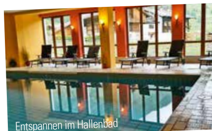
Entspannen im Hallenbad

Alle Zimmer sind mit Flachbild- und Sat-TV ausgestattet. Kostenloses WLAN ist in allen öffentlichen Bereichen verfügbar.