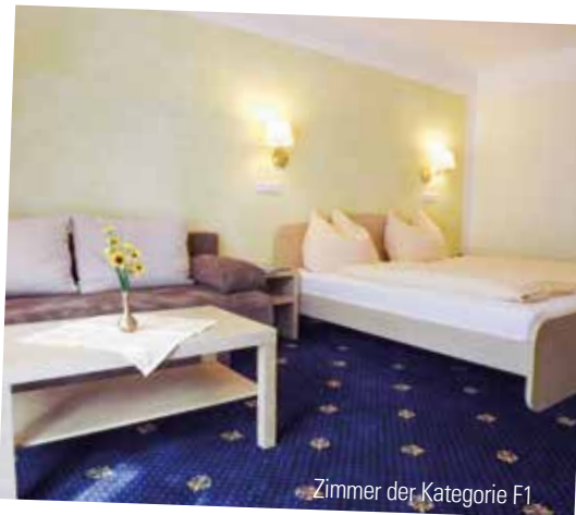
Zimmer der Kategorie F1